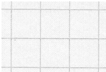
Quadretti di 1-2 a : (1 cm di lato)

Un LIBRO in lingua inglese e un LIBRO in lingua italiana da condividere nella biblioteca di classe